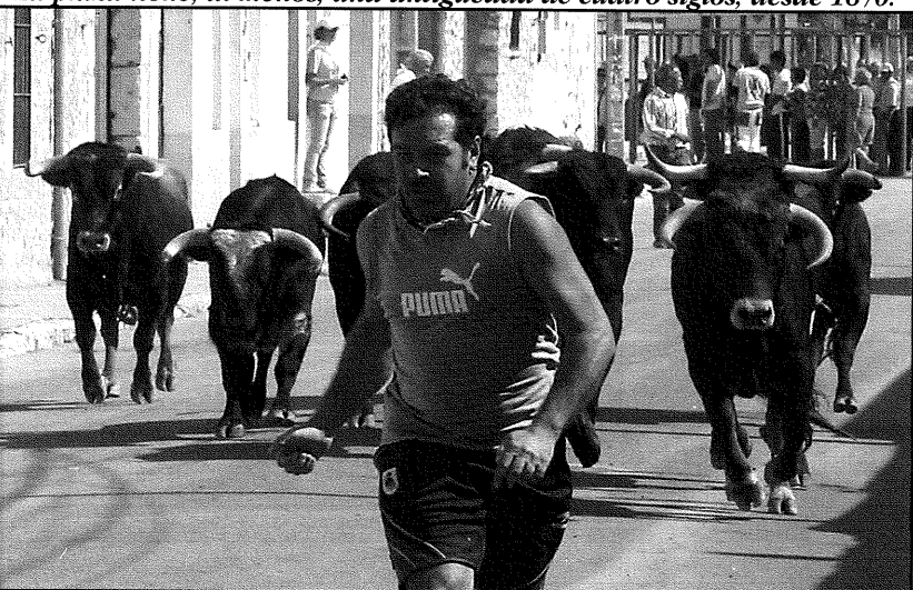
ACTE quiere declarar Bien de Interés Turístico a la plaza y a los festejos.

H ablar de Montemayor de Pililla (Valladolid) es hablar de afición por el toro, hablar de toros es hablar de su plaza de palos y hablando de ésta, hablamos de A.C.T.E. (Asociación Cultural Taurina La Empalizada).